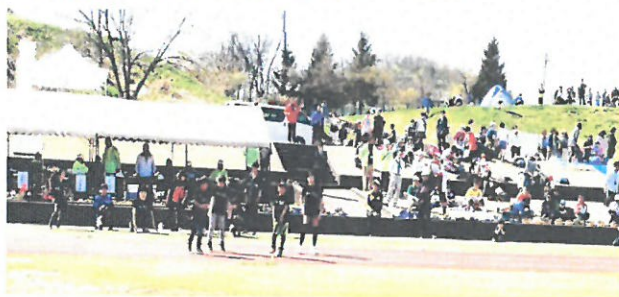
「見附刈谷田川ハーフマラソン大会」での「HIPHOP」教室パフォーマンス