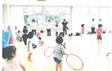
ちびっこスポーツ万能教室