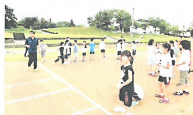
夏休みジュニア陸上教室