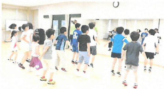
ジュニアスポーツ万能教室